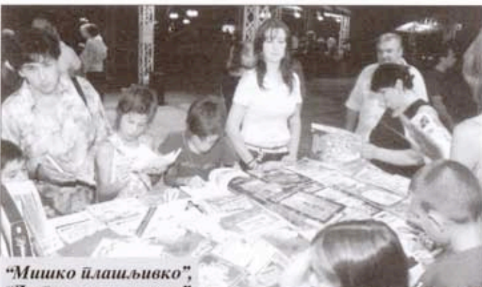
"Мишко љлашљивко", "Да љукнеш од смеха", "Сћоменар мој дећин- сћива" и слични насло- ви на "Плаћоовом" оћвореном шћангу, као земља из бајке