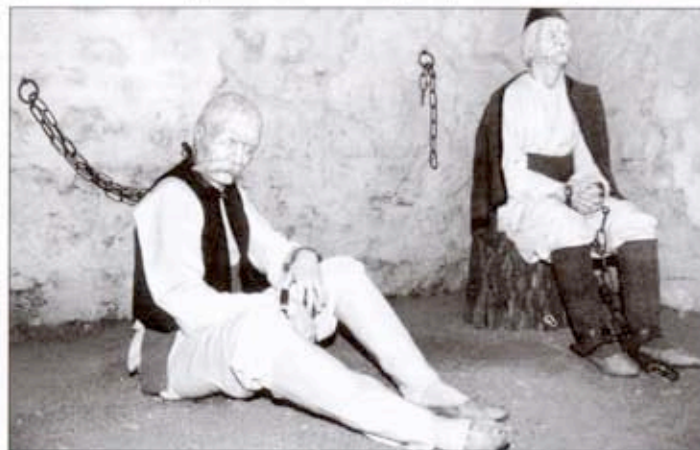
Нова поставка у Муселимовом конаку