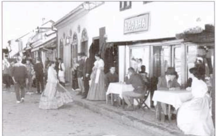
Уз помоћ костима у амбијенту Тешњара оживљено време обреновићевске Србије