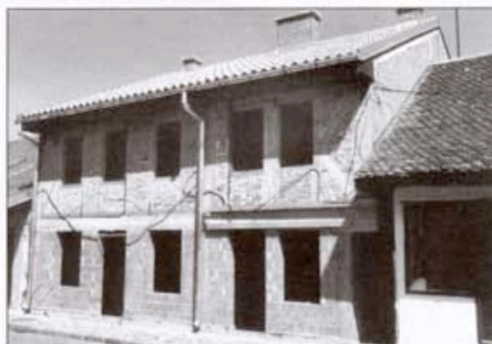
Стара кафана Кљештавица није одолела зубу времена и сада, реконструисана под надзором Завода, живи свој нови живот

целини која нигде у Србији није сачувана, а притом треба и станарима тих кућа омогућити потребан комфор (у погледу санитарних инсталација). Мислим да је свако улагање у очување Тешњара, уз умерену и строго дефинисану градњу нових кућа, на темељима старих и уз строго поштовање услова, дефинисаних законом о заштити културних добара, тачније старих градских целина, посао вредан сваке пажње.