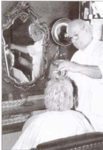
У Миловом салону у Тешњару

—У Ваљево сам доживео све што један човек може пожелети и што се сматра успешним животом, и у погледу посла и у погледу породице. Када се сада, на одласку у пензију осврнем на све то, немам разлога за незадовољство. Истина, као млад талентован фризер, ја сам, као члан уметничког удружења фризера имао понуду да одем у Лондон, али ме је, изгледа тешњарска калдрма тако снажно "приковала" за ово место да сам тај позив подредио животу овде, и, верујте, нисам се покајао. Моји мирни ваљевски дани, моја породица и љубав према послу јединоставно