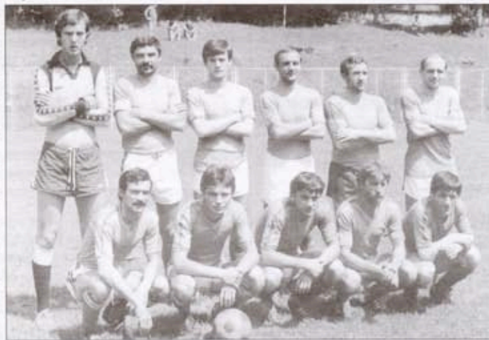
ФК Тешњар 1979. године

шање. Поред Тешњараца, у првим годинама било је и играча из Попара и Баира, а на утакмицама су имали и баварску музичку подршку која