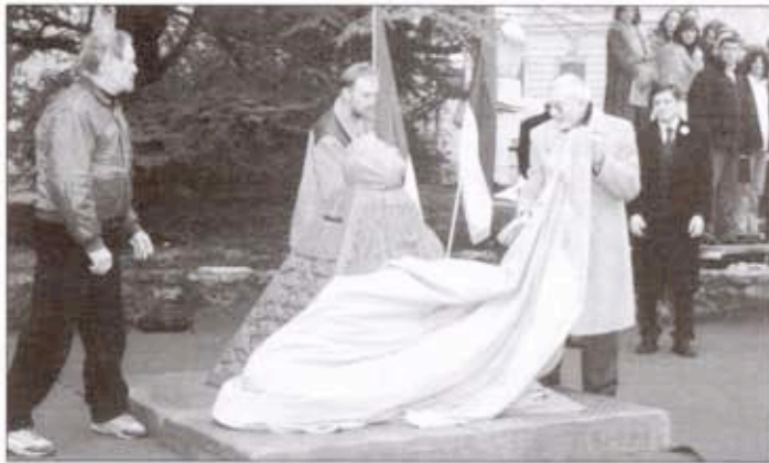
Отварање споменика који је месецима безглављен

Април: обележен светски дан Рома; књиге по жељи и у затвор; одржан фестивал фолклора "Златни опанак"; обнавља се