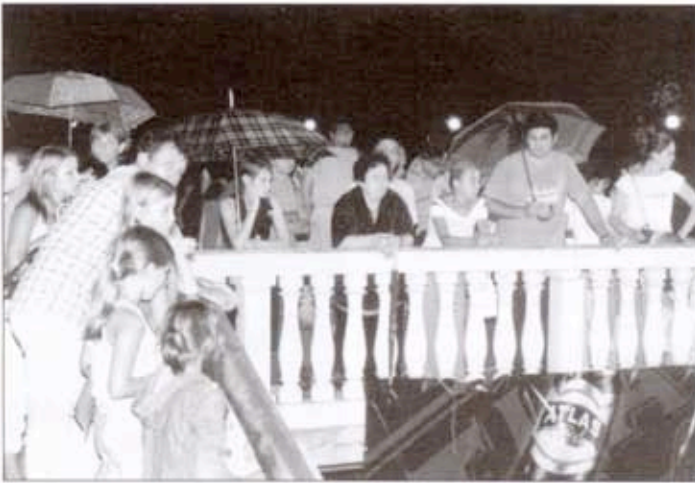
Киша, редован сценски ефектај "Тешњарских"