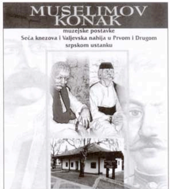
Проспект – Још једна од публикација Музеја