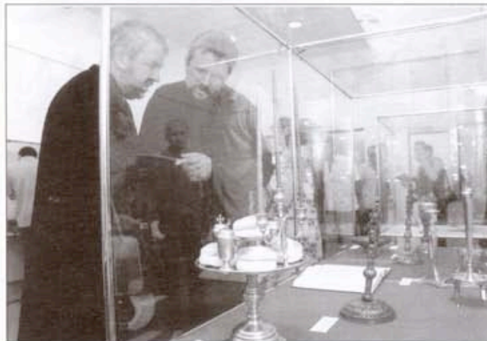
Са изложбе у Народном музеју

- Одлучио сам се на једнокраке свећњаке и на њима зауставио, управо због тога што сви остали облици свећњака физички, али и комуникационо, симболички, произилазе из основне форме. Ограничио сам се на последња два века употребе, време у којем се са сигурношћу може пратити континуитет у традиционалном животу и богослужбеној употреби.