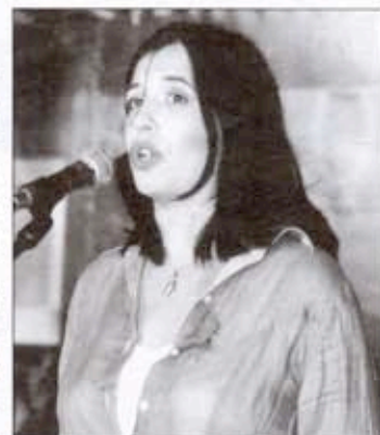
Нела отвара Тешњарске вечери

Још једном хвала на великом задовољству овог тренутка и нека нам је са срећом пунолетство Тешњарских вечери. Тешњарске вечери су отворене.