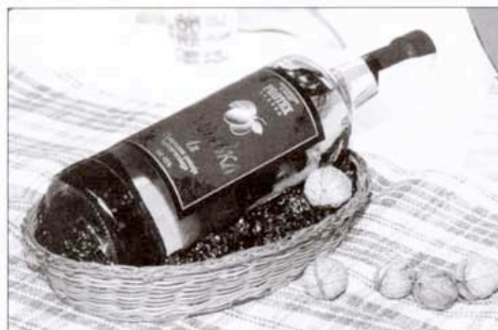
Ракија „Ваљевка“ – Може ли то бити ваљевски бренд?

утицима, који ће их можда вратити и наредне године. Међу њима су и гости који долазе преко Друштва пријатељства са Фафенхофеном, који посећују програме, спавају у хотелу, иду у туристичке туре. Значи да та манифестација може допринети приливу