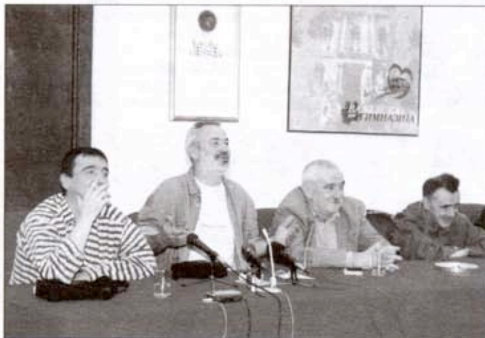
Са промоције у сали Гимназије