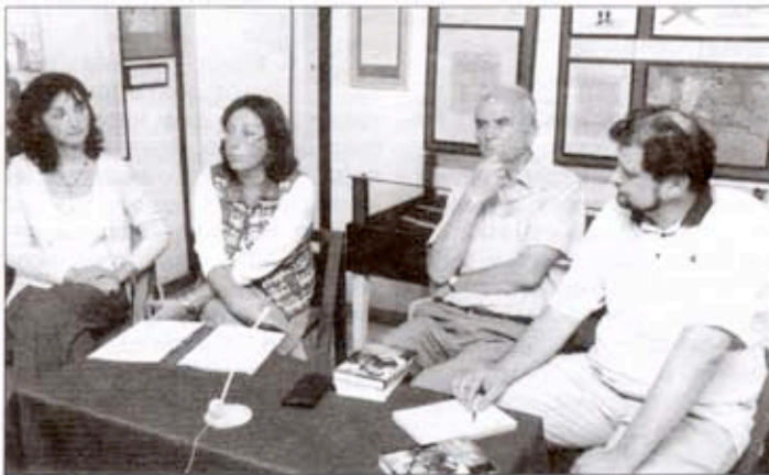
Представљање књиге „Историја европске идеје“