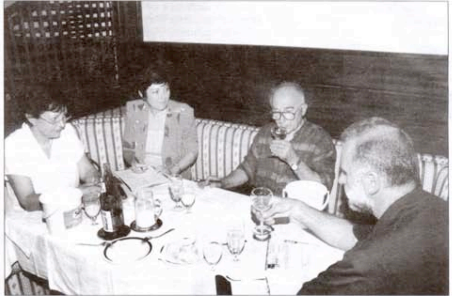
Комисија оцењује ваљевску ракију

Он је као пример навео овогодишњег такмичара, чија је ракија добила прву награду, који претходних година није добијао признања, али је сваке године радио по препорукама и исправљао оно што је његовој шљивовици недостајало.