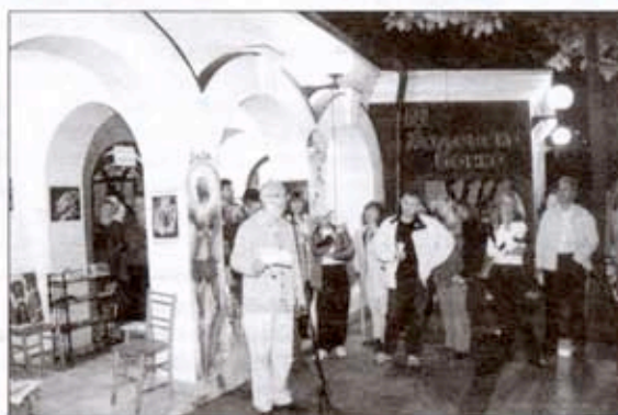
Једна од промоција на штанду „Хиландара”