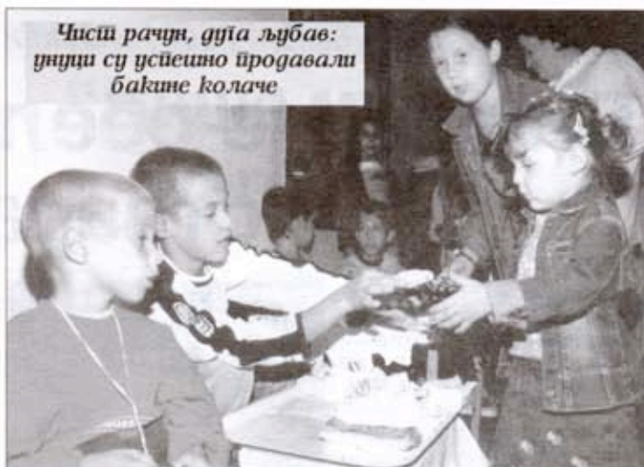
Чисти рачун, дућа љубав: уници су успешно продавали бакине колаче