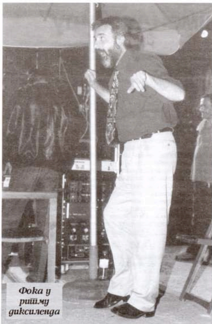
Фока у ришму диксиленда