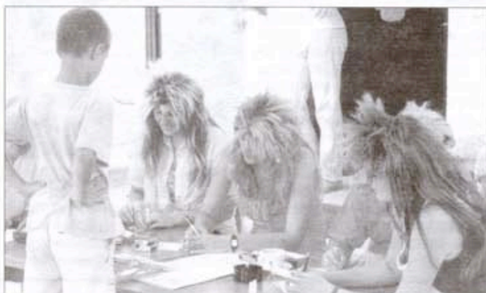
Није сакућљање пошписа за кандидатуре: костимиране васпшпачице прикућљају пријаве за учешће на маскенбалу