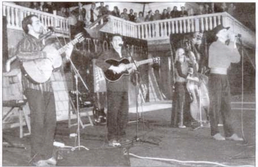
Група „Амаро Дел“

У традиционалном термину позоришних догађања, на Тргу кнегиње Љубице,