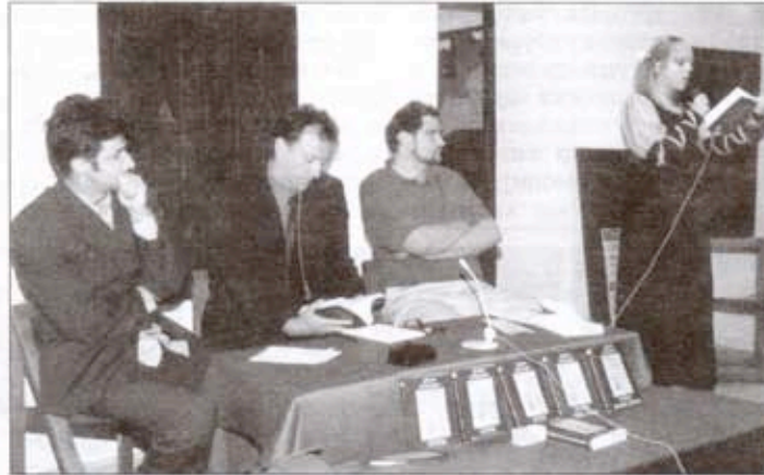
Са промоције књиге „Летопис великих жупана“