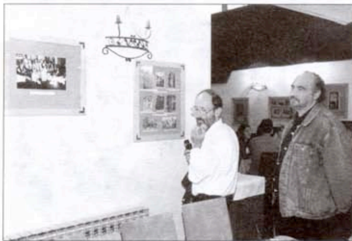
Са отварања изложбе фотографија

Цела концепција овог културног пројекта плод је ангажовања ромског Радија "Точак", Ромског центра за демократију и Дома културе, а по свему виђеном очито је да итекако има места да се и у наредним годинама култура наших суграђана Рома нађе у програмима овог летњег фестивала.