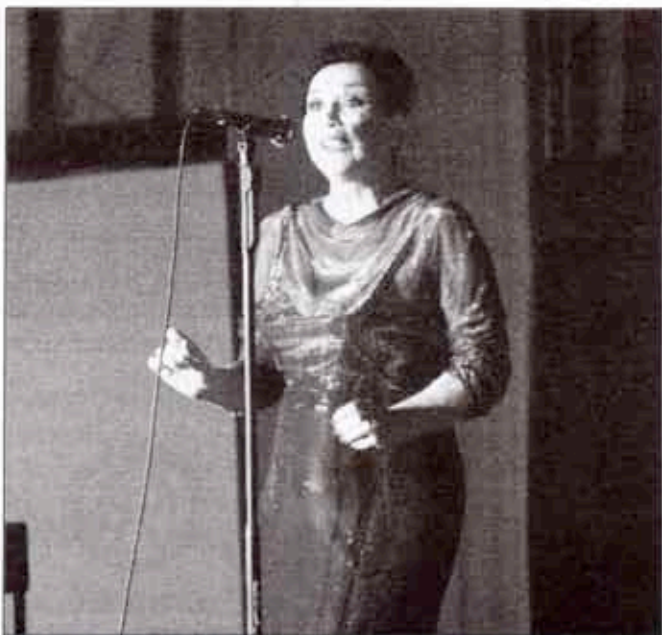
Примадона Јасна Шајновић