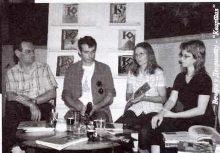
Вечери у Доориницу - "Картал"