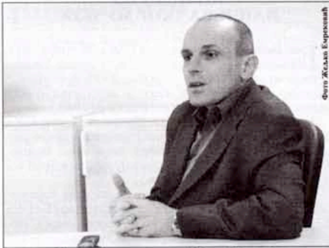
Фото Желко Бркић