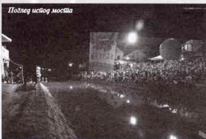
Поглед исвод моста