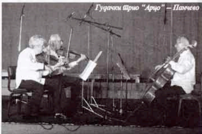
Гудачки Шрио "Арџо" – Панчево