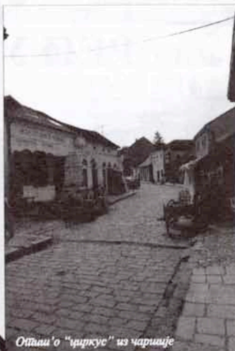
Оттаи'o "циркус" из чаршије