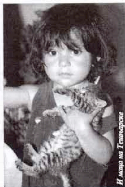
И маца на Темњарске