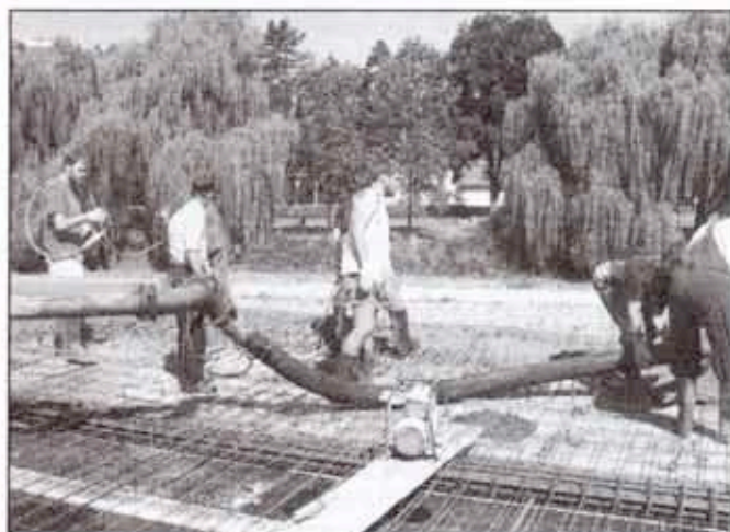
Трећа плоча Дома истраживача