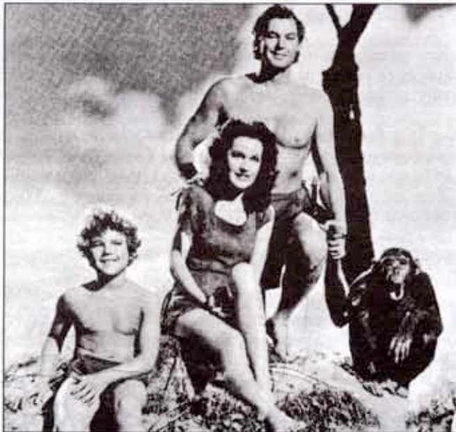
ТАРЗАН - М. О' Саливен и Џ. Вајсмилер