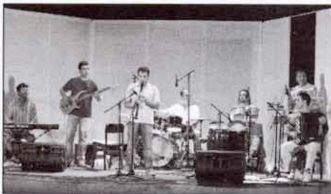
"Огњен и пријатељи"

У наставку промотивне фестивалске вечери ансамбл "Огњен и пријатељи" из Панчева извео је изванредан концерт етно-џез музике, нажалост, пред премало публике.