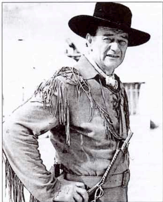
АЛАМО - Џон Вејн